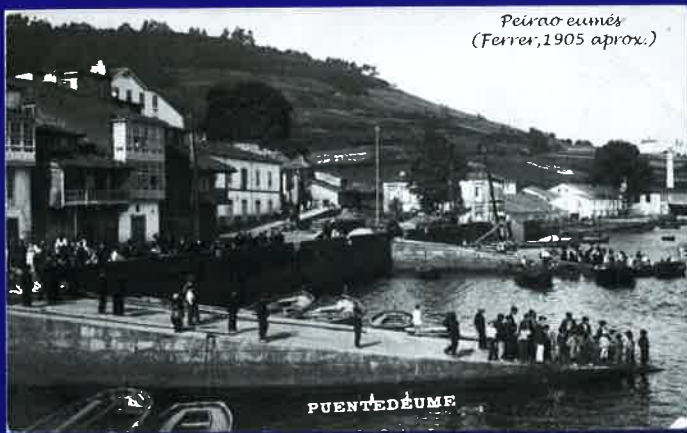
Peirao eumés (Ferrer, 1905 aprox.)