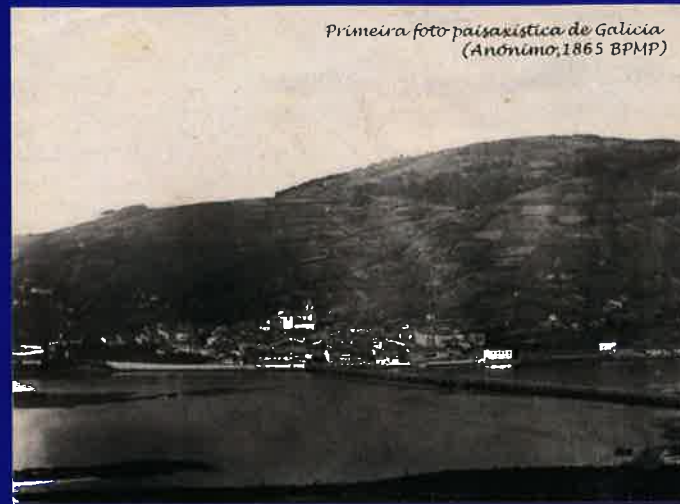
Primeira foto paisaxística de Galicia (Anónimo, 1865 BPMP)

Pasando os anos, esa perspectiva dende Cabanas foi repetida mil veces, tanto por fotógrafos profesionais como aficionados, confirmando o acerto estético do anónimo pioneiro.