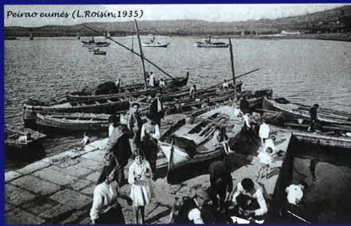
Peirao eumés