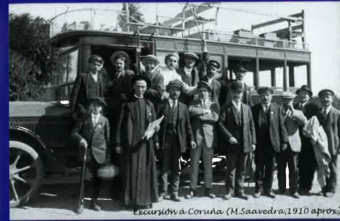
Excursión á Coruña (M.Saavedra, 1910 aprox)

Numerosos documentos conservados permiten reconstruír o importante asociacionismo eumés que comezou en 1908 coa " Hermandad Marítima ", a única organización mariñeira impulsada polos solidarios . Foi seguida por outros sindicatos anarquistas ( Sociedad de Marineros Pescadores de 1914, Unión de Pescadores de 1919), de armadores ( Gremio de Armadores de tarrafas de 1920) e polo Pósito que tivo períodos realmente destacados. Nos tempos da República o Sindicato Único de Trabaxadores representou ós máis de cincocentos eumeses vencellados coa pesca.